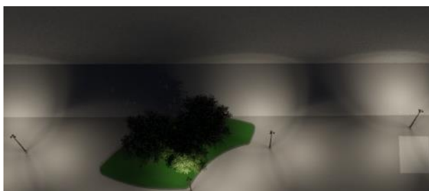
Kuvat ovat luonnostasoisia ideakuvia, joiden tarkoitus on kuvata ainoastaan valaistuksen visuaalista ilmettä ja periaatteita.

Alla olevassa kuvassa on havainnollistettu aukion valaistusperiaatetta, joka antaa aukiolle pehmeää ilmettä ja korostaa kiveyspinnan tekstuuria pimeään aikaan. Samalla yksittäisten kohteiden ja yksityiskohdeiden valaiseminen on mahdollista. Käyttäjälle tämän tyyppinen valo on turvallinen ja mielenkiintoinen. Aukion oleskelualueella käytetään myös rakenteisiin integroitua epäsuoraa valoa tuottavaa erikoisvalaistusta. Kuvat ovat luonnostasoisia ideakuvia, joiden tarkoitus on kuvata ainoastaan valaistuksen visuaalista ilmettä ja periaatteita.