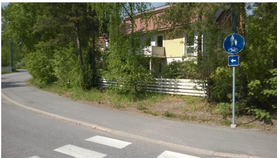
Kauniaisten yhdistetyt jk/pp väylät ovat usein kapeat

Jalankulun ja pyöräilyn verkko on pääosiltaan hyvin jäsenelty ja tiivis vaikkakin verkollinen jatkuvuus vaihtelee kaupungin eri osissa. Kauniaisissa on noin 25km jalankulku- ja pyöräteitä jotka lähes kaikki ovat yhdistettyjä jk/pp-väyliä. Leveydeltään nämä eivät aina vastaa mitoituksen ohjearvoja.