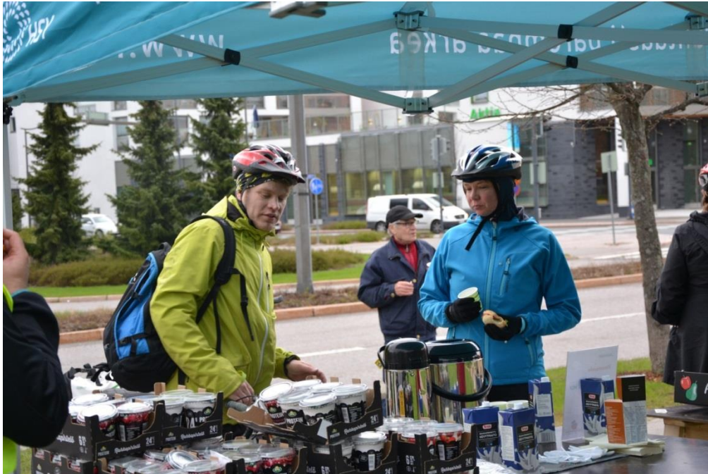
HSY:n Ilmastoinfon kanssa järjestettävät pyöräilyaamiaiset ovat suosittuja tapahtumia

Pyöräilyn edistämiseen kuuluvat suunnitelmallinen viestintä sekä pyöräilytapahtumat. Markkinoinnilla ja viestinnällä lisätään ihmisten tietoisuutta tarjolla olevista palveluista sekä luodaan positiivisia mielikuvia. Kampanjoiden ja tapahtumien avulla pyritään houkuttelemaan ihmisiä kokeilemaan pyöräilyä sekä lisäämään tietoisuutta pyöräilyn olosuhteista.