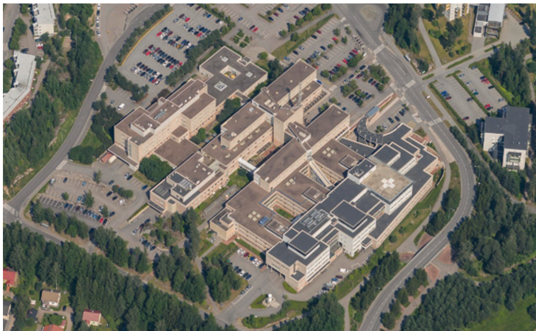
Kuva 12. Peijaksen sairaala-alue

Jorvin päivystyslisärakennuksessa Espoolla on käytössään 22 sairaansijaa. Lisäksi Espoolla on Jorvin tornirakennuksessa nyt 81 sairaansijaa, jotka poistuvat Espoon käytöstä kun uusi Espoon sairaala valmistuu. Jorvin kampusta kehitetään yhdeksi yhteiseksi ja saumattomaksi kokonaisuudeksi. HUS omistaa Jorvin sairaala-alueen tontin.