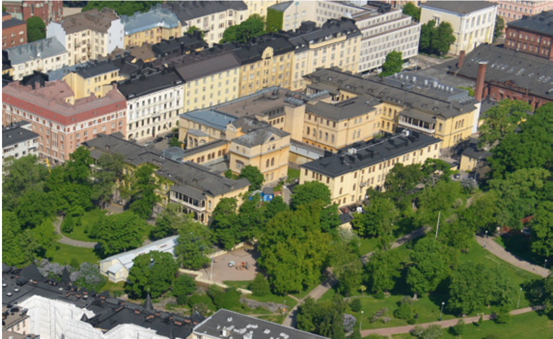
Kuva 10. Kirurginen sairaala