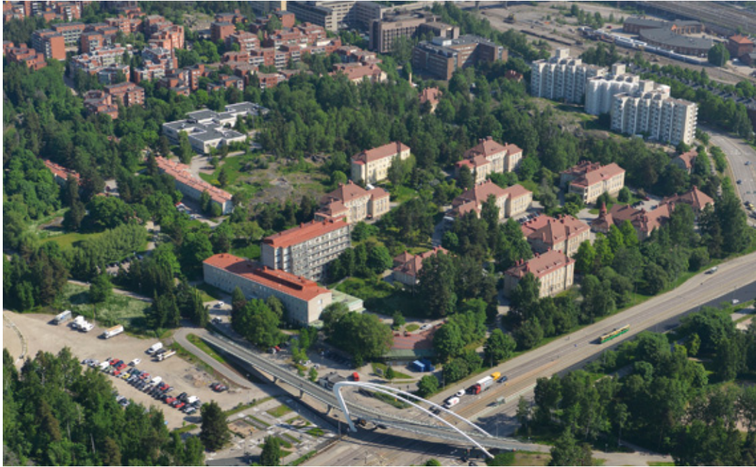
Kuva 3. Auroran sairaala-alue