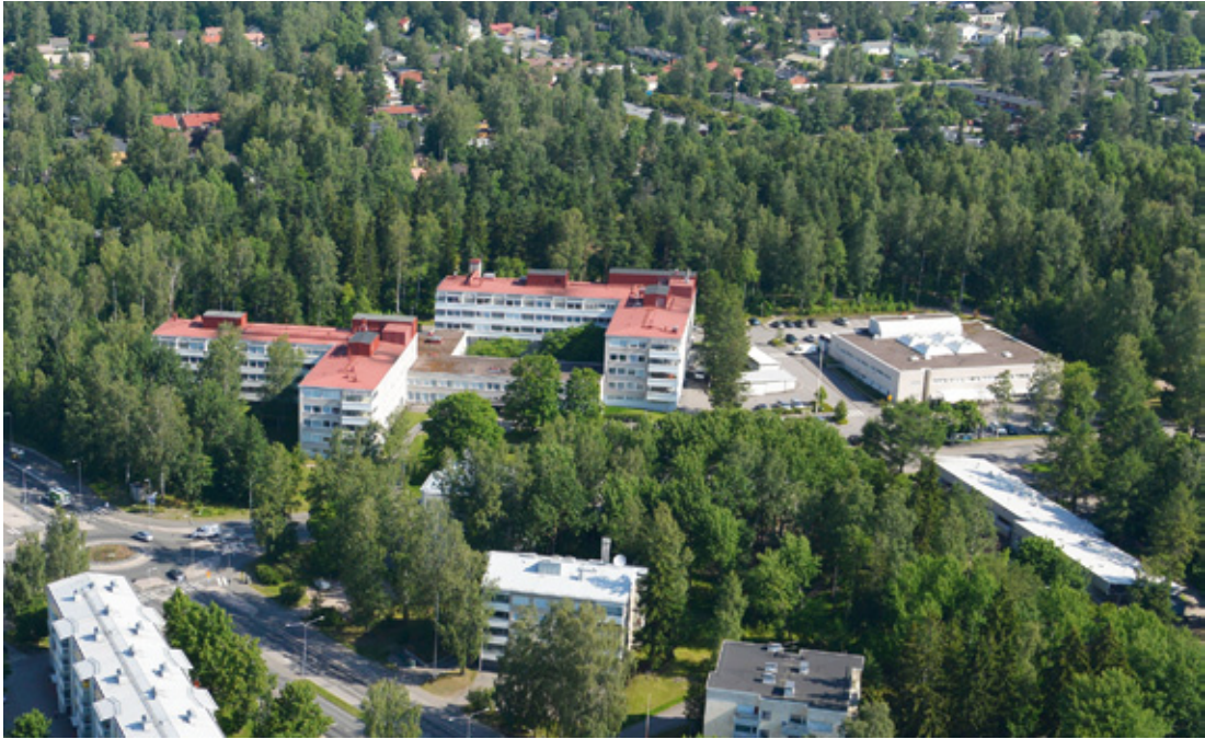
Kuva 4. Suursoon sairaala