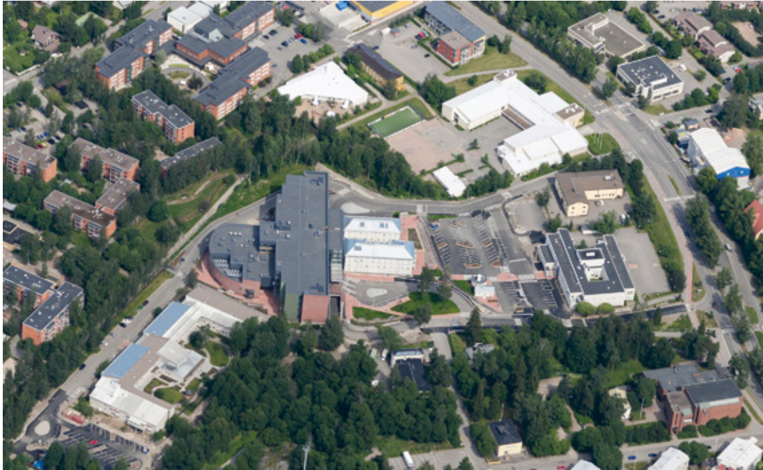
Kuva 1. Malmin sairaala-alue