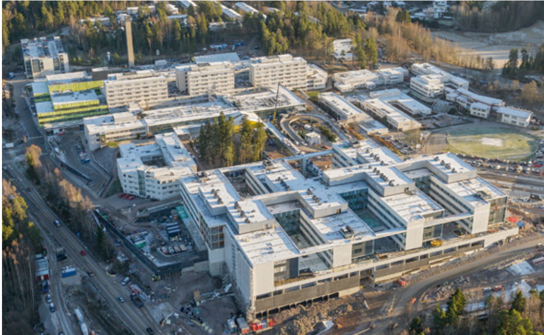
Kuva 11. Jorvin sairaala-alue