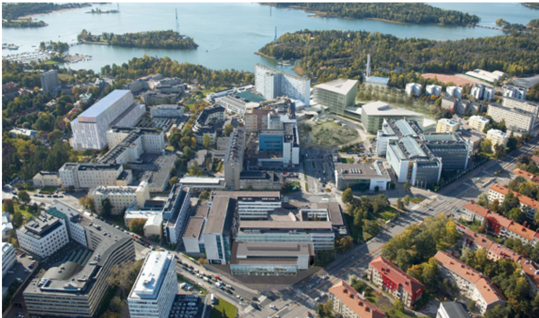
Kuva 7. Meilahden sairaala-alue Uuden lastensairaalan ja Siltasairaalan rakentamisen jälkeen

Alla olevassa sairaalakohtaisessa esityksessä on HUS:n sairaansijamäärät ilmoitettu niin, että ne sisältävät myös tehostetun hoidon, tehovalvonnan ym. hoitopaikkojen määrät vuonna 2016.