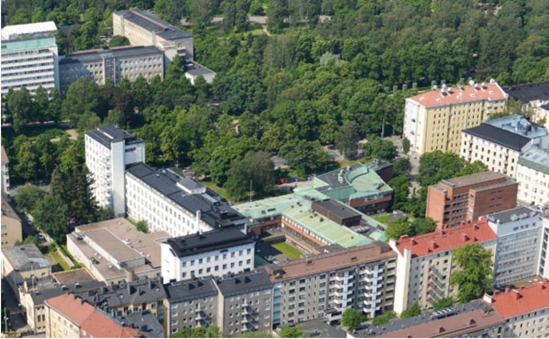
Kuva 9. Töölön sairaalan alue