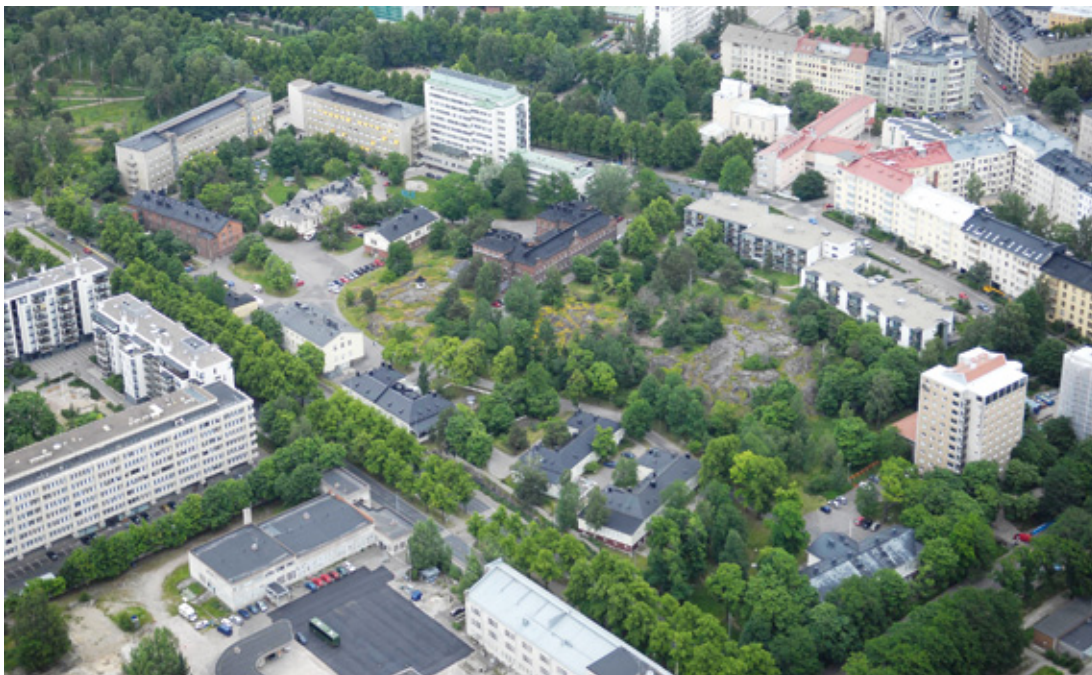
Kuva 6. Kivellä–Hesperian sairaala-alue