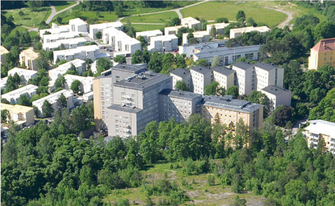
Kuva 5. Kätilöopiston sairaala