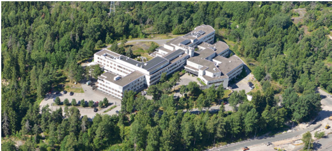
Kuva 8. Iho- ja allergiasairaala

Lastenpsykiatrian ja lastenneurologian erikoisalojen Lastenlinna sijaitsee Meilahden kampuksen yhteydessä. Toiminta loppuu vuonna 2018, kun toiminnot siirretään osittain Uuteen lastensairaalaan ja myöhemmin osittain mm. Lastenklinikan rakennukseen. Osa rakennuksesta on alustavasti suunniteltu peruskorjattavaksi hammaslääketieteen perusopetuksen tiloiksi. Vaihtoehtona on myös kiinteistön realisoiminen. Lastenlinnan sairaalan yhteydessä olevassa Ulfäsa-rakennuksessa on HYKS Psykiatrian nuorisopsykiatriasta toimintaa (14 ss).