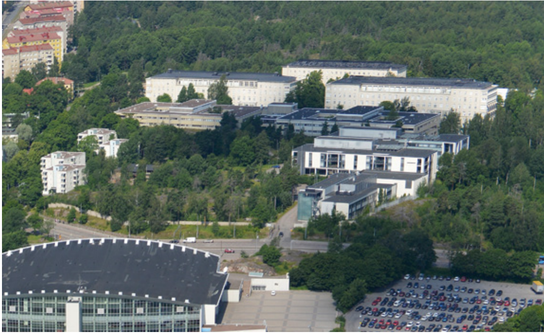
Kuva 2. Laakson sairaala-alue