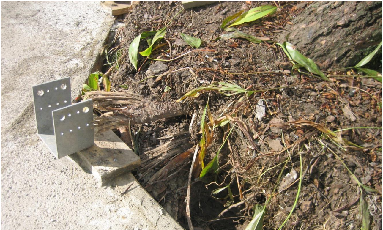
Rakennustöiden yhteydessä vaurioitunut männyn hoitamaton juuristo.

Suurien puiden juuria katkotaan mahdollisimman vähän, jotta puiden ankkurointi maahan säilyy. Vahingoittuneet halkaisijaltaan yli 20 mm:n juuret hoidetaan. Katkottaessa säilytettävien puiden juuria ne sahataan kohtisuoraan poikki seuraavan vahingoittumattoman ja terveen verson yläpuolelta. Hoidettuja katkaisukohtia ei jätetä alttiiksi auringonpaisteelle, tuulelle ja pakkaselle, vaan ne peitetään välittömästi suojapeitteellä, kunnes kaivanto täytetään. Jos juuri katkaistaan kasvukauden aikana, kasvin juuristoalue kastellaan runsaasti ennen katkaisukohtien peittämistä. Jos kaivanto joudutaan pitämään täyttämättä viikkoa kauemmin, kastelu toistetaan kerran viikossa (InfraRyl 2010).