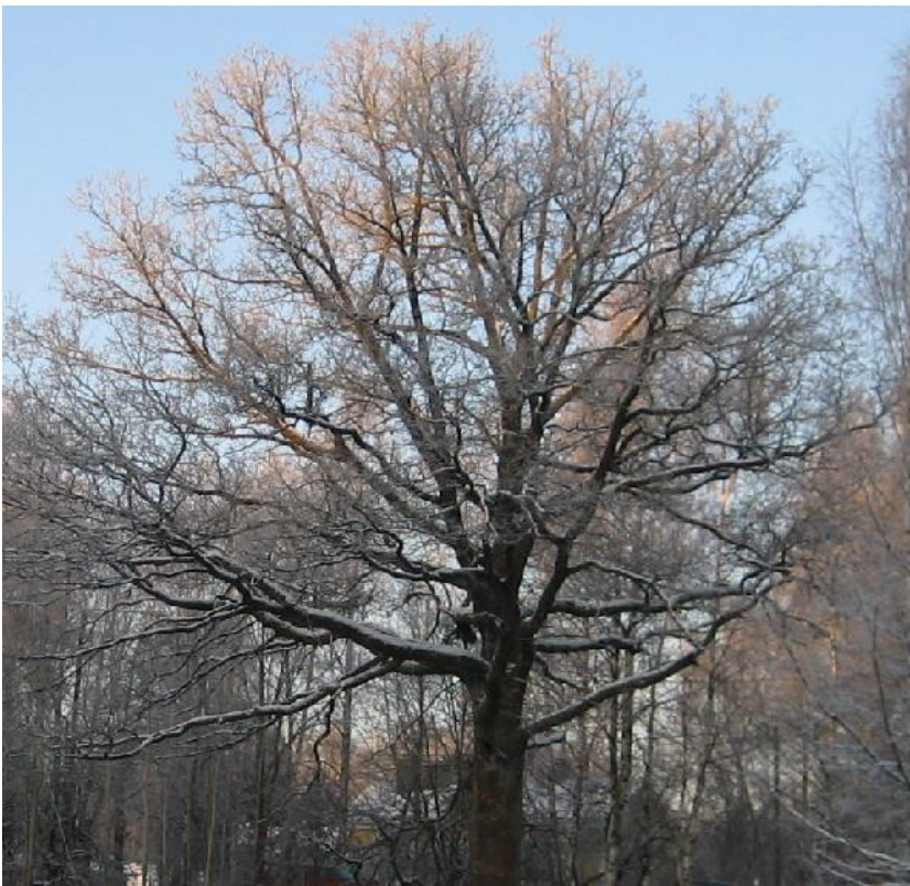
Komea yksittäistammi Kauniaisissa.

Kauniaisissa halutaan säilyttää mahdollisimman paljon puustoa kaupunkikuvallisista ym. vastaavista syistä. Tontilla voi kasvaa maisemallisesti merkittävä puu tai puuryhmä. Erityisesti tulee suosia kauniita yksittäispuita, puuryhmiä ja metsiköitä, jaloja lehti- ja havupuita sekä muodoltaan ja kasvutavaltaan erikoisia puita. Puustoa, joka selvästi suojaa tonttia tuulelta, melulta, ilman epäpuhtauksilta tai muilta häiriötekijöiltä, tulisi pyrkiä säilyttämään.